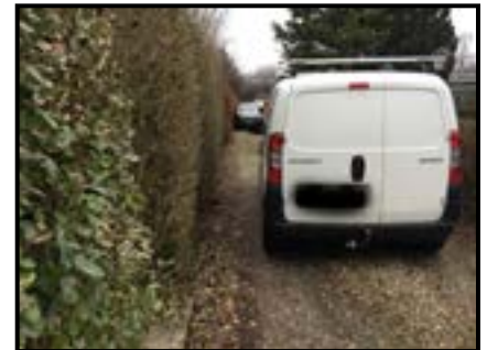
Græsribat brugt til parkering