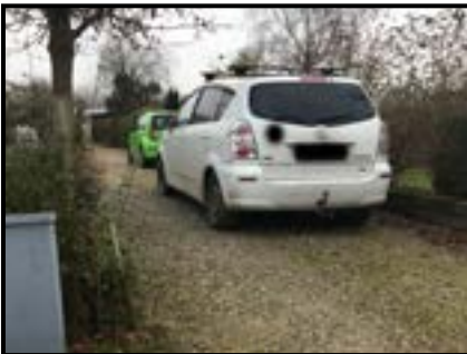
Parkering på stikveje

Nedenstående billeder er udelukkende for at illustrere problemstillingen.